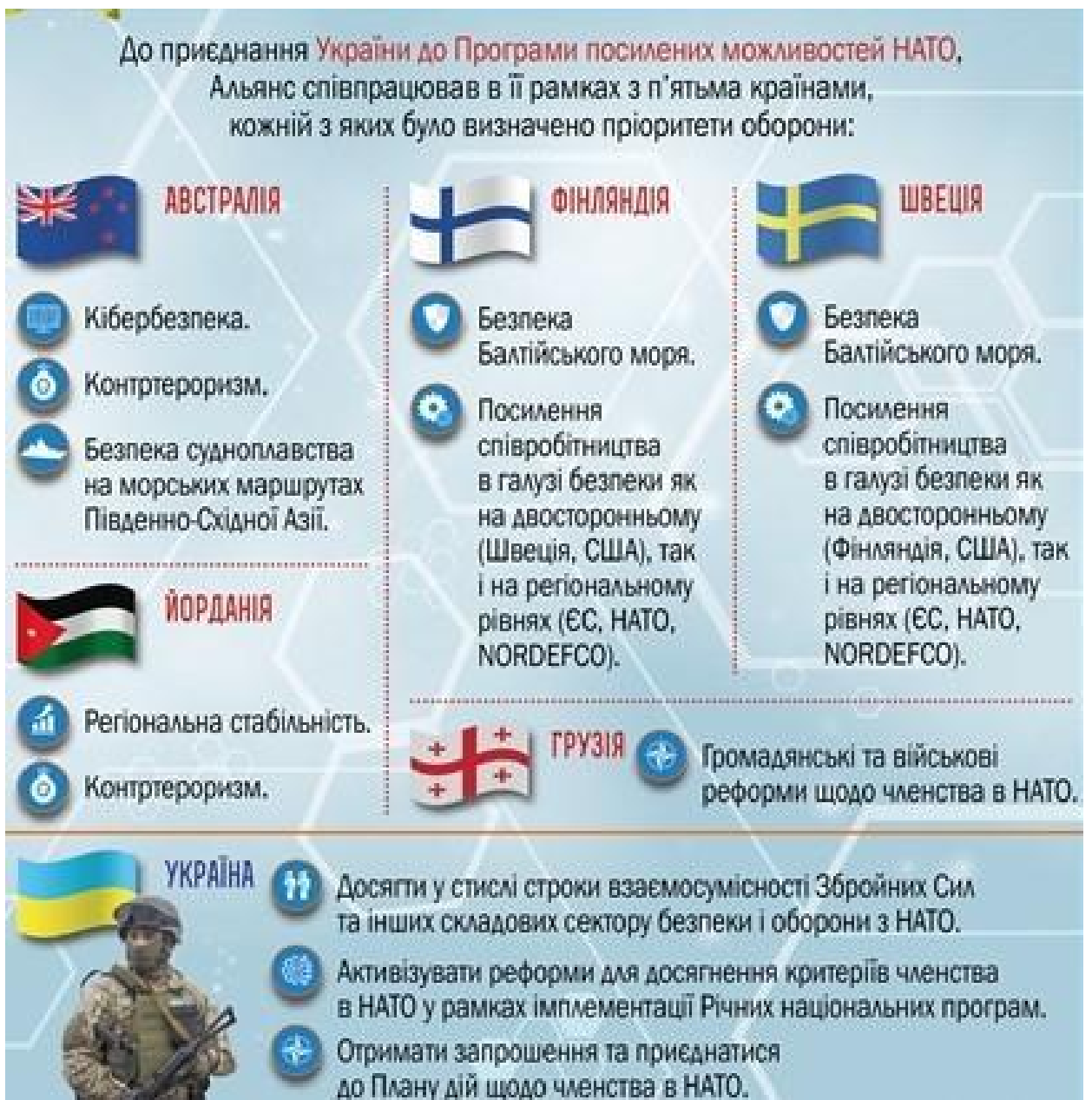
Рис. 1. Співпраця Альянсу в рамках Програми посилених можливостей

У свою чергу, Україна активно працює над покращенням своїх шансів на прийняття до НАТО, здійснюючи ряд заходів: