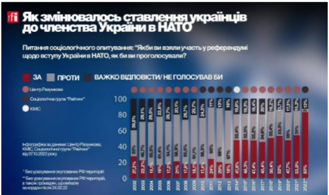
Рис. 2. Ставлення українців до НАТО

Президент Володимир Зеленський подав заявку на пришвидшений вступ України до НАТО у відповідь на незаконне приєднання Росією українських територій. Це рішення відображає зміну ставлення українців до членства в НАТО, яке раніше було більш поділене. Наприклад, у 2002 р. думки жителів України розділилися майже порівну – 27.2% за вступ, а 33% проти. Зараз, після років впливу російської пропаганди та зростаючої загрози з боку Росії, більшість українців вважають членство в НАТО важливим для забезпечення безпеки країни.