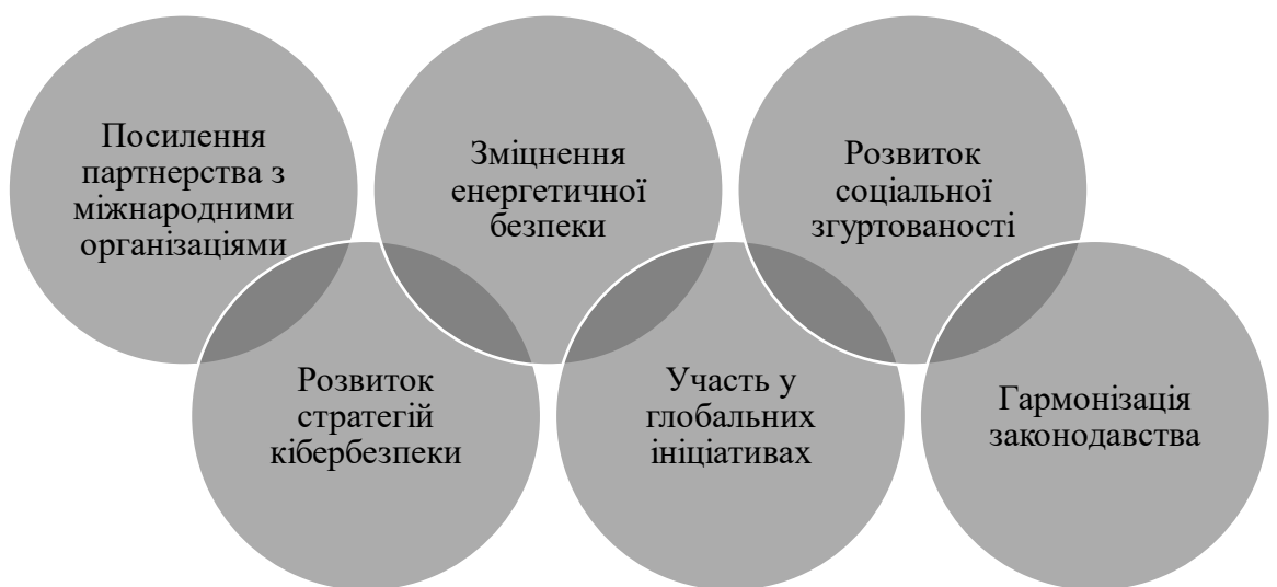
Рис. 3.4. Можливості розвитку безпеки країн пострадянського простору в умовах глобалізації (складено автором)

Відповідно, на нашу думку, існують такі можливості розвитку безпеки країн пострадянського простору в умовах глобалізації (рис. 3.4).