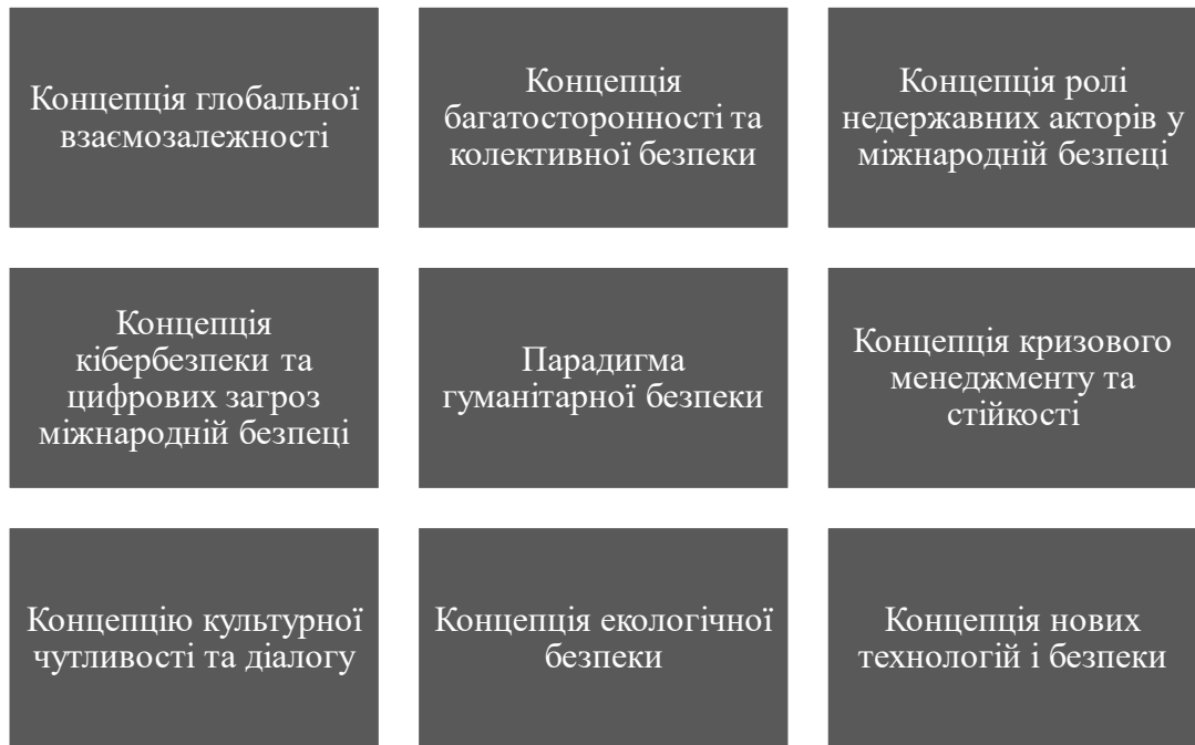
Рис. 1.2. Концепції міжнародної безпеки [65, с.96]

міжнародної безпеки потребують адаптації та переосмислення, що робить їх предметом активних досліджень у сфері міжнародних відносин.