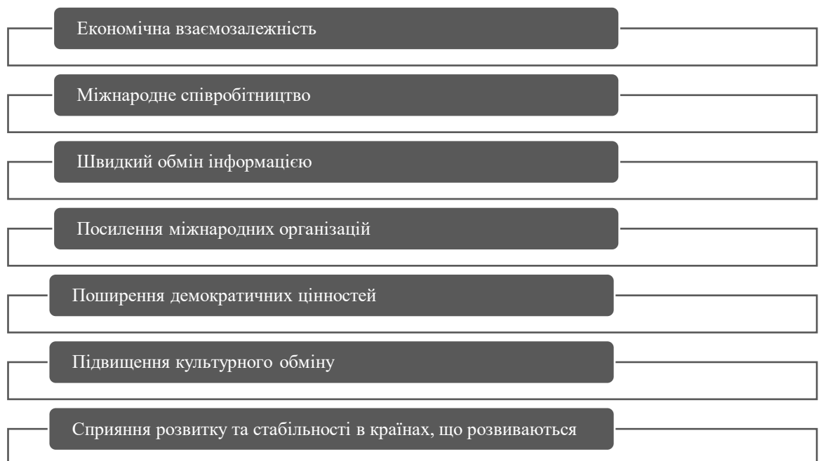
Рис. 2.1. Позитивні аспекти глобалізації в контексті міжнародної безпеки [24, с.30]

Розглянемо детальніше позитивні аспекти глобалізації в контексті міжнародної безпеки (рис. 2.1).