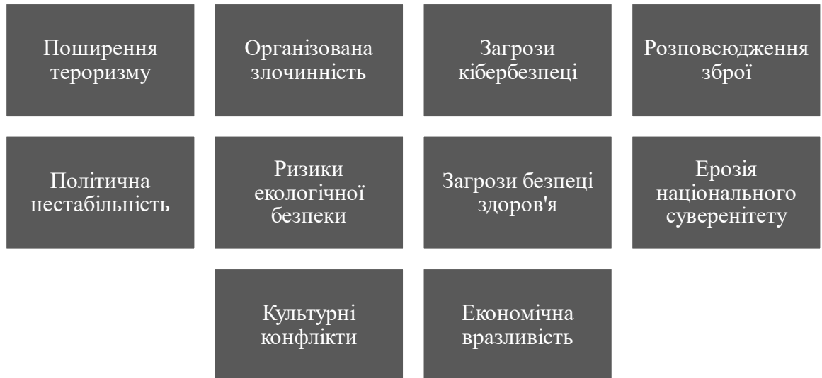
Рис. 2.2. Негативні аспекти глобалізації в контексті міжнародної безпеки [18]

Розглянемо детальніше негативні аспекти глобалізації в контексті міжнародної безпеки (рис. 2.2).