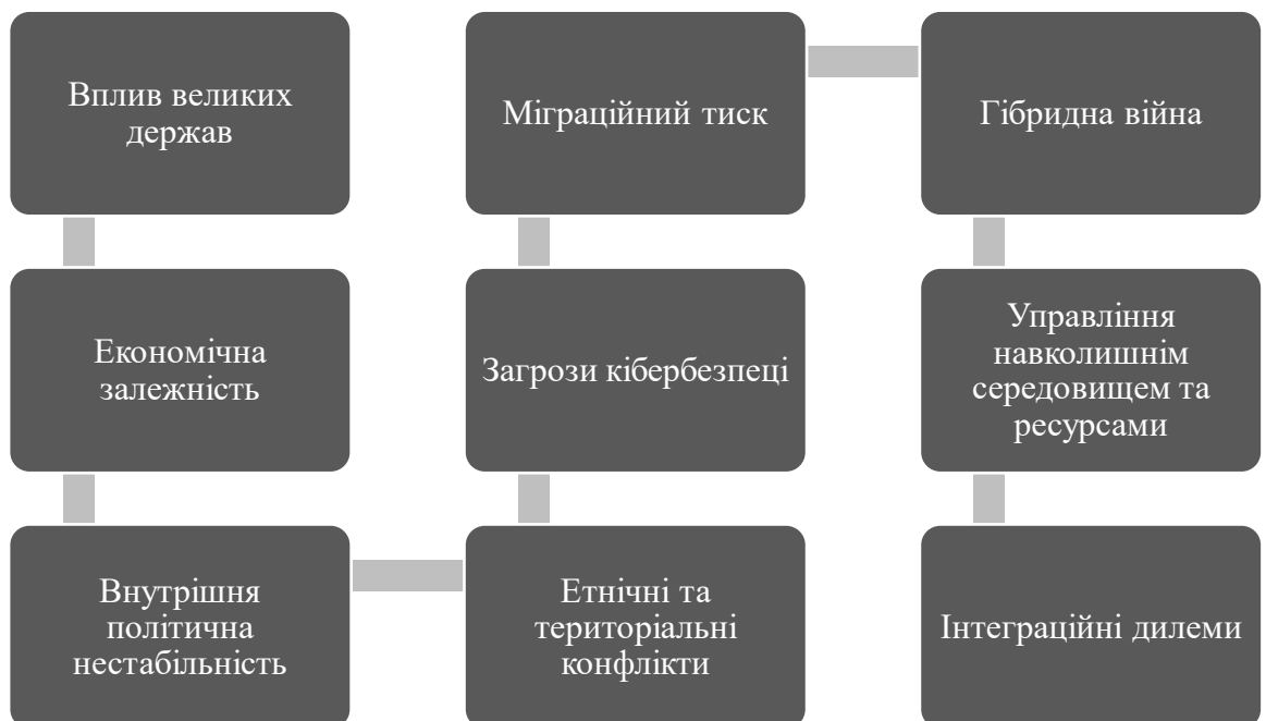
Рис. 3.1. Геополітичні виклики та ризики для країн пострадянського простору в умовах глобалізації [69, с.19]

Геополітичні виклики та ризики на пострадянському просторі в умовах глобалізації набувають дедалі більшої складності, впливаючи на стабільність та безпеку регіону. Після розпаду СРСР країни пострадянського простору зіткнулися з необхідністю вибудовувати нову ідентичність та формувати незалежну зовнішню політику в умовах посилення глобальних взаємозв'язків. Однак вплив глобалізаційних процесів часто супроводжується ризиками, такими як економічна та політична залежність, посилення внутрішніх конфліктів, а також геополітичний тиск з боку великих держав, зокрема Росії, США та ЄС (рис. 3.1). Конкуренція між державами та загрози гібридного впливу також створюють нестабільність, що може загрожувати міжнародній безпеці та інтеграційним прагненням окремих країн регіону.