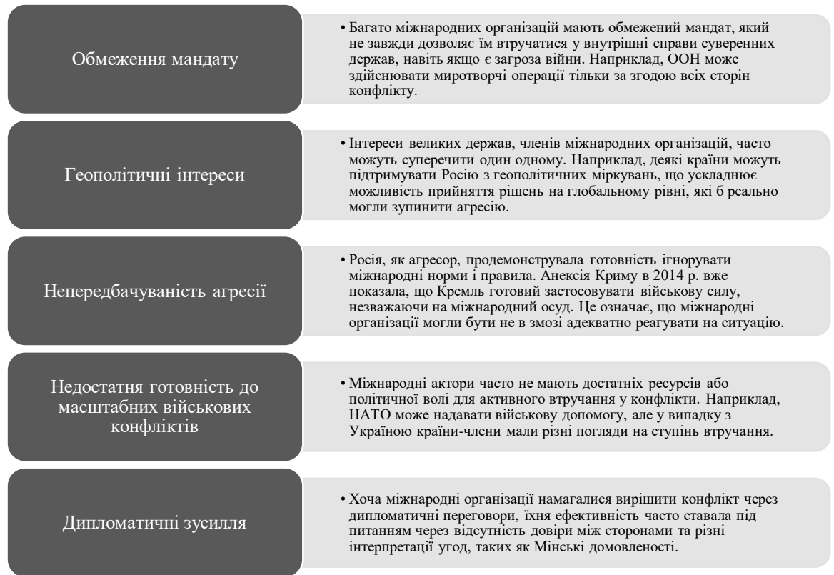
Рис. 3.2. Причини неефективності міжнародних акторів у забезпеченні безпеки пострадянських країн: аналіз українського досвіду [79, с.196]

Для того, щоб визначити можливості розвитку безпеки країн пострадянського простору в умовах глобалізації, з'ясуємо причини, чому міжнародні організації, такі як ООН, НАТО та інші, не змогли запобігти повномасштабній війні в Україні (рис. 3.2).